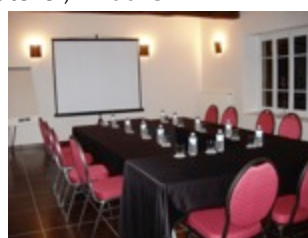
Salles de réunion