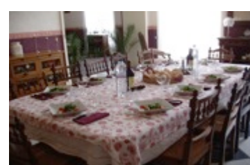
Salle à manger du château